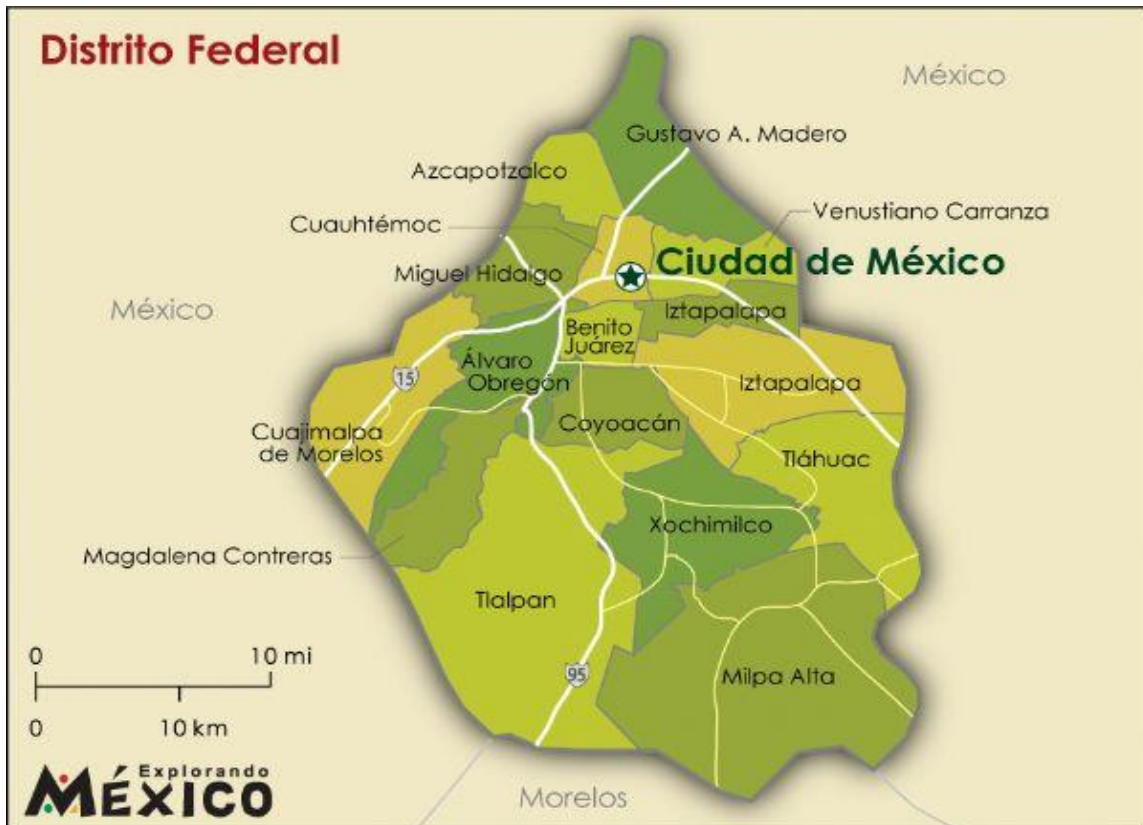
Imagen 6-1. UBICACIÓN DE LA DELEGACIÓN CUAUHTÉMOC.